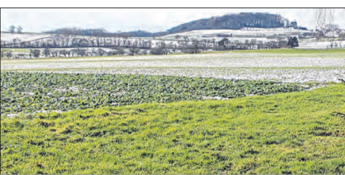
Das Baugebiet »Sophie von Brabant«.