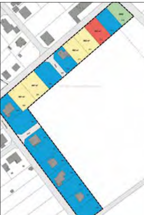
Im Baugebiet »Grundblick« in Rauschholzhausen sind noch vier Bauplätze frei.

Eine kommunikative Mitte mit den vielfältigsten Angeboten sei im Ortskern entstanden. »Hier gibt es alle Dinge des täglichen Bedarfs: vom Einkaufen über wichtige Dienstleistungen, Ärzte, die Gemeindeverwaltung, eine große Kita und Grundschule, das neue Bürgerzentrum und vieles andere mehr«, zählt der Rathauschef auf. Die Attraktivität Dreihäusens spiele eine bedeutende Rolle. Denn von diesem Wohngebiet aus sei das Zentrum in wenigen Minuten zu Fuß erreichbar.