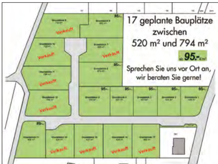
Im Baugebiet »Am Sonnenhang« in Dreihäusen sind bereits neun von 17 Bauplätzen verkauft.

Das Bauleitplanverfahren wurde im vergangenen Monat abgeschlossen. Nachdem der Bebauungsplan rechtskräftig ist, hat die Mittelhessische Planungs- und Entwicklungsgesellschaft mbH (MPE) vor kurzem mit der Erschließung des