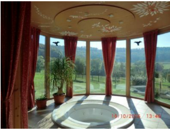
Whirlpool - Relax pur