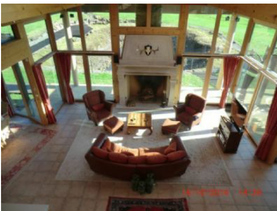
Blick von der Empore