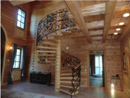
Aufgang zum OG