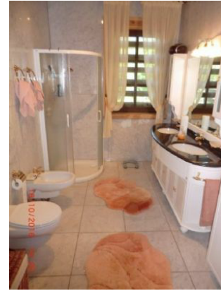
Exklusives Bad Nr.1