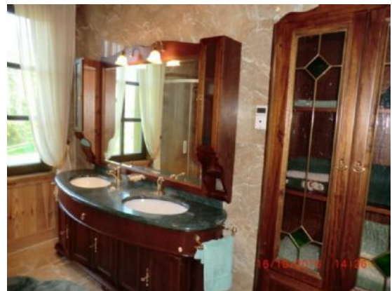
großzügiges Bad Nr.2