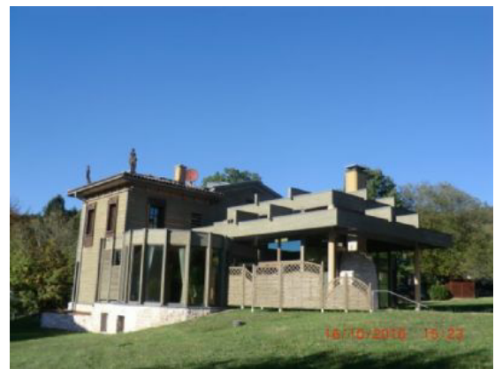
Aussicht vom Wohnbereich